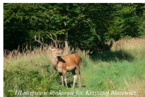
III miejsce w konkursie