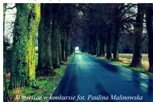
II miejsce w konkursie