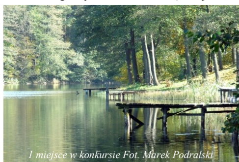
I miejsce w konkursie