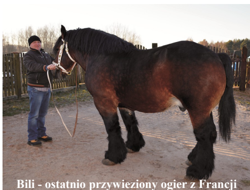
Bili - ostatnio przywieziony ogier z Francji

Tak, to jest bardzo ciężka praca. Na początku zaczynaliśmy od dwóch koni. M i e s z k a l i ś m y w Głędach, a konie trzymaliśmy w stajni w Trokajnach. Codziennie trzeba było dojeżdżać i te konie doglądać. Następnie przyszła kolejna klacz i kolejna i z dwóch zrobiło się ładne stadko 18 koni.