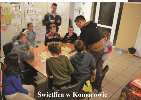
Świetlica w Komorowie