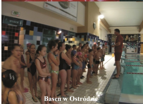
Basen w Ostródzie