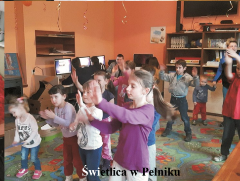
Świetlica w Pelniku