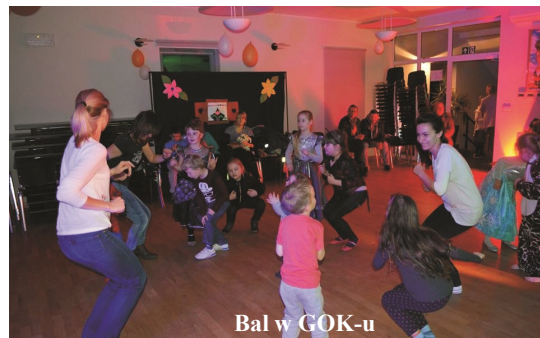
Bal w GOK-u