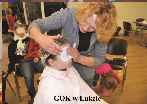
GOK w Łukcie