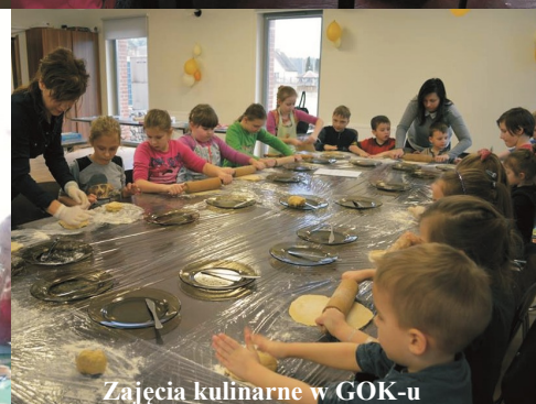
Zajęcia kulinarne w GOK-u