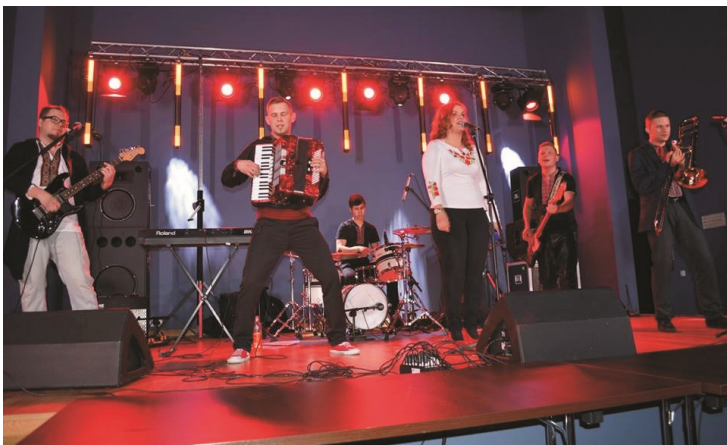
„Na zakup urządzeń medycznych dla oddziałów pediatrycznych oraz dla zapewnienia godnej opieki medycznej seniorów”

W niedzielę, 10 stycznia 2016 roku, 120 tysięcy wolontariuszy 24. Finału Wielkiej Orkiestry Świątecznej Pomocy wyszło na ulice nie tylko polskich miast, ale także w kilkudziesięciu krajach na świecie. Przez 23 lata działalności Fundacja WOŚP zakupiła sprzęt medyczny wydając