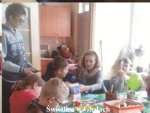
Świetlica w Głędach