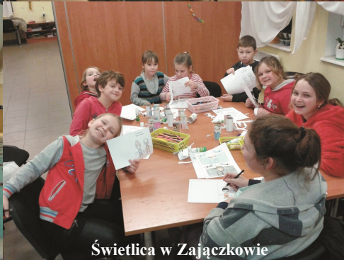
Świetlica w Zajączkowie