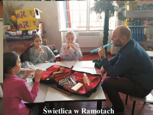
Świetlica w Ramotach