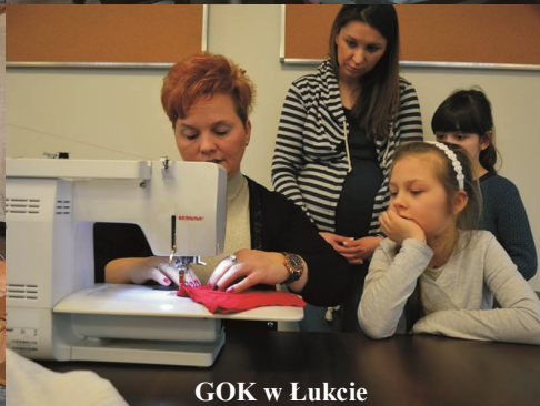
GOK w Łukcie