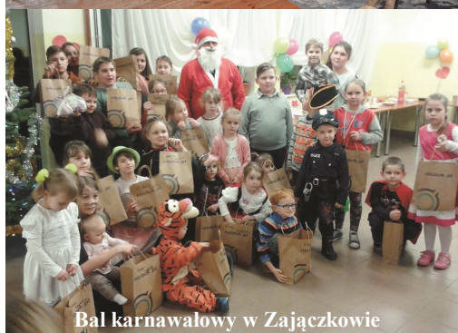
Bal karnawalowy w Zajączkowie