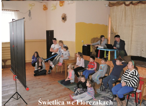
Świetlica we Florzakach