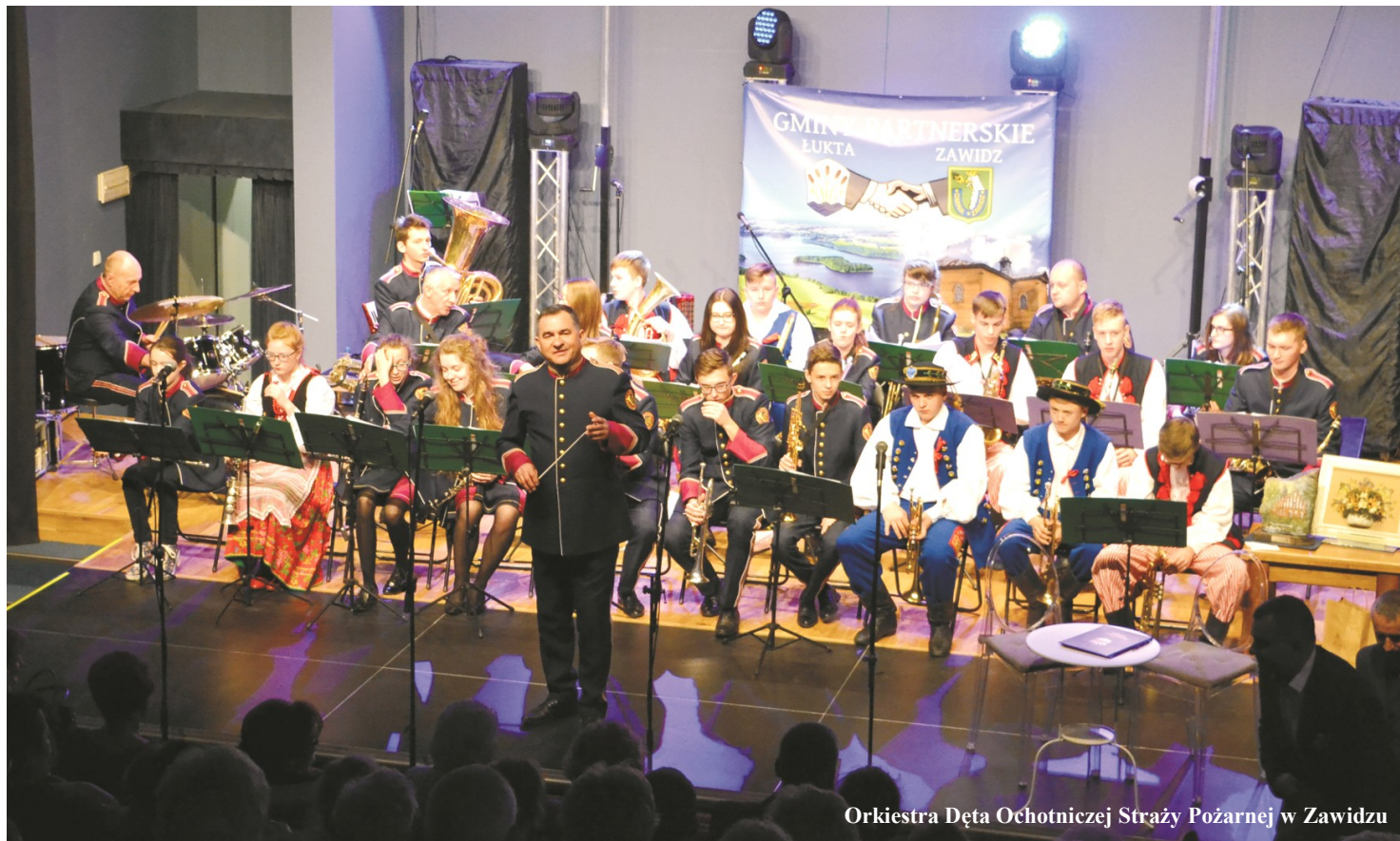
Orkiestra Dęta Ochotniczej Straży Pożarnej w Zawidzu