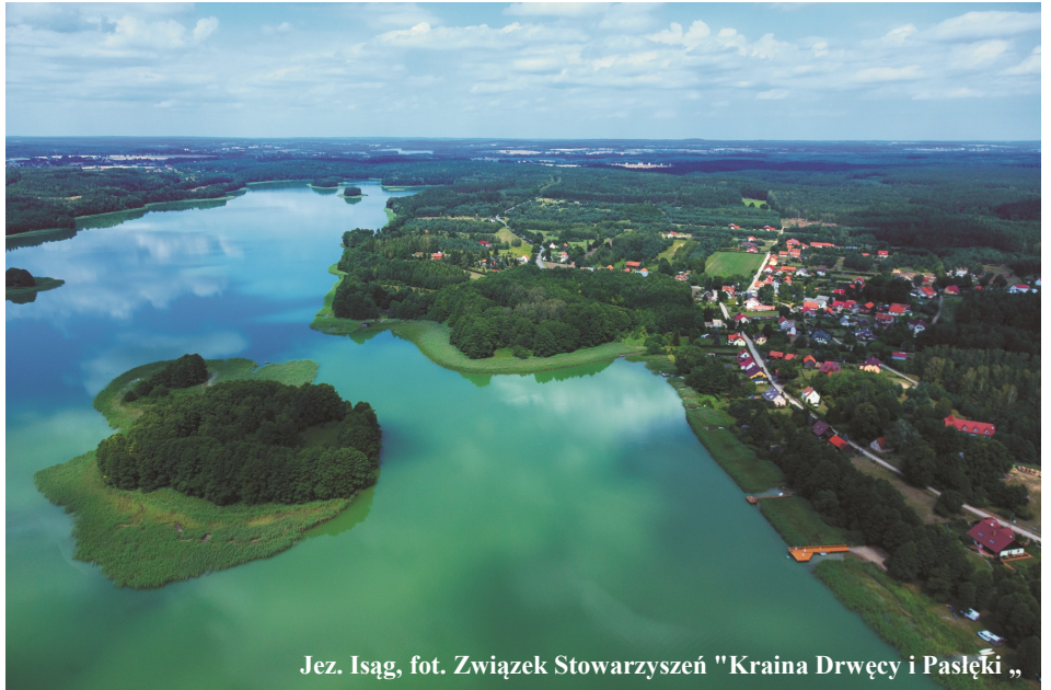
Jez. Isąg, fot. Związek Stowarzyszeń "Kraina Drwęcy i Pasłęki „

- Przed mostem w Łęguckim Młynie jest granica powiatu ostródzkiego i olsztyńskiego, oraz Gminy Łukta i Gminy Gietrzwałd, a nieopodal na