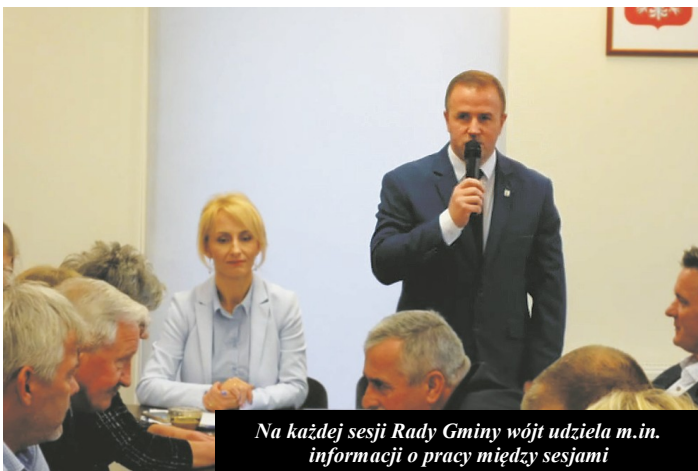
Na każdej sesji Rady Gminy wójt udziela m.in. informacji o pracy między sesjami

Wspierając inicjatywy mieszkańców będziemy modernizować wiejskie boiska sportowe np. w Ramotach, starać się o dofinansowanie siłowni zewnętrznych w kolejnych miejscowościach i działać na rzecz integracji środowiska.