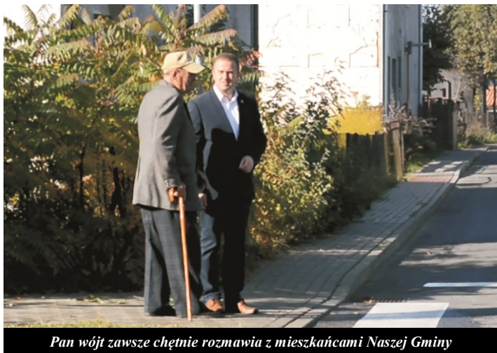
Pan wójt zawsze chętnie rozmawia z mieszkańcami Naszej Gminy