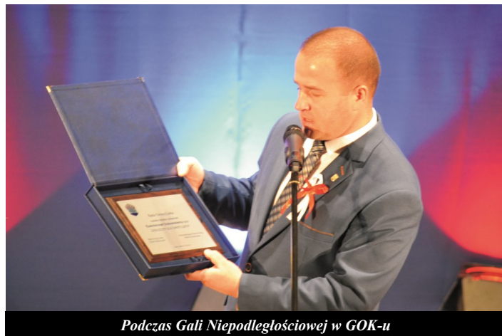
Podczas Gali Niepodległościowej w GOK-u

Poza tym stawiam na szeroki dialog z mieszkańcami, aby z jednej strony mogli wskazać czego jeszcze brakuje u nas w gminie, a z drugiej mogli wypowiedzieć się na temat tych największych, planowanych inwestycji. Ten dialog został już podjęty poprzez utworzenie funduszy sołectkich. Mieszkańcy sami będą decydować na co spożytkują pieniądze w swoich „małych ojczyznach”, a są to naprawdę duże środki. Sołectwo Łukta ma do rozdysponowania ponad 65 000,00 zł i już złożyło wnioszek, w którym przewiduje wydanie 8 000,00 zł na