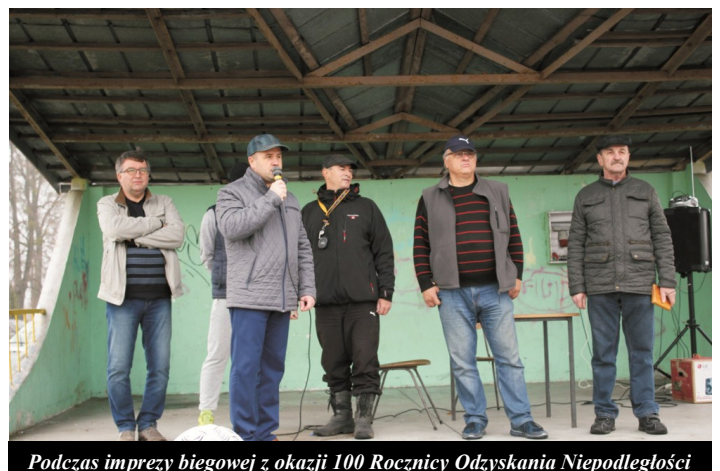
Podczas imprezy biegowej z okazji 100. Rocznicy Odzyskania Niepodległości