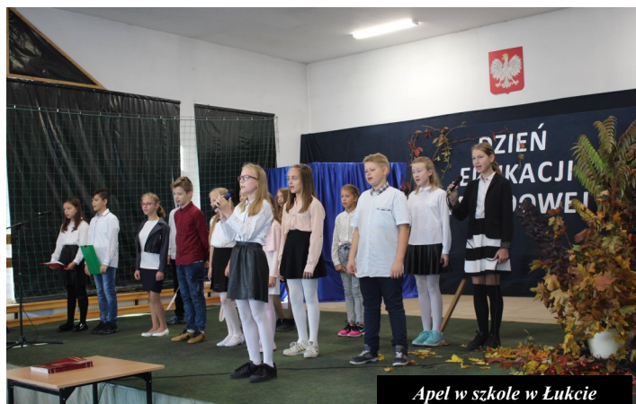
Apel w szkole w Łukcie