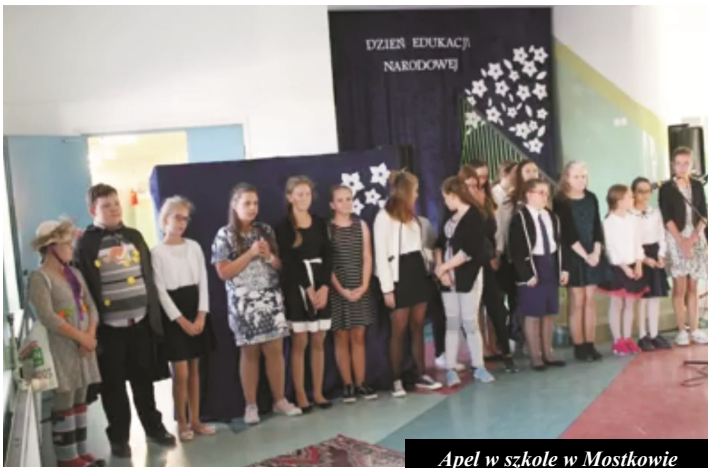
Apel w szkole w Mostkowie