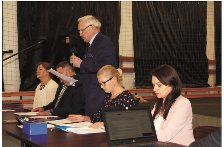
Urząd Gminy w Łukcie

Objęcie obowiązków przez wójta nastąpiło z chwilą złożenia wobec rady gminy ślubowania o następującej treści: "Obejmując urząd wójta gminy, uroczyście ślubuję, że dochowam wierności prawu, a powierzony mi urząd sprawować będę tylko dla dobra publicznego i pomyślności mieszkańców gminy."