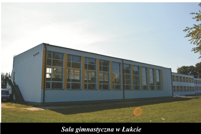
Sala gimnastyczna w Łukcie

Głównym celem termomodernizacji było zmniejszenie zużycia energii końcowej i pierwotnej oraz ograniczenie emisji dwutlenku węgla i pyłów co bezpośrednio wpływa na poprawę efektywności energetycznej publicznych budynków w naszej gminie. Oprócz tego projekt przewidział cele dodatkowe, a wśród nich: zwiększenie komfortu użytkowania budynków przez interesariuszy, poprawa jakości powietrza atmosferycznego, zmniejszenie negatywnych presji środowiskowych na obszary cenne przyrodniczo zlokalizowane zarówno w gminie jak i całym województwie warmińsko – mazurskim, zmniejszenie kosztów eksploatacyjnych budynków publicznych czy podniesienie świadomości ekologicznej mieszkańców.