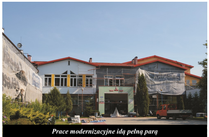
Prace modernizacyjne idą pełną parą