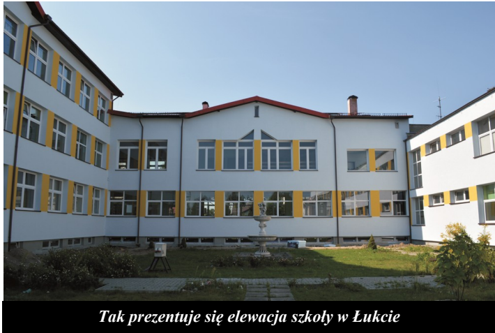
Tak prezentuje się elewacja szkoły w Łukcie

Jest sierpień – realizacja projektu „Termomodernizacja Zespołu Szkolno – Przedszkolnego w Łukcie”, którego prace ruszyły 14 lutego 2018 roku, a Gmina Łukta dnia 29 września 2017 roku podpisała umowę o dofinansowanie, trwa na całego. Wszystko to w ramach Regionalnego Programu Operacyjnego Województwa Warmińsko – Mazurskiego na lata 2014 – 2020.