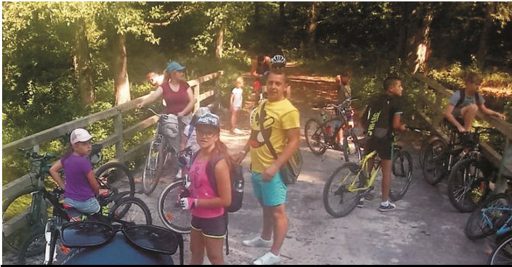
Wycieczka rowerowa - przystanek nad Pasłęką

Od początku lipca Gminny Ośrodek Kultury w Łukcie przygotował dla dzieci i młodzieży wiele zróżnicowanych porannych atrakcji. Każdy tydzień podzielony został na tematyczne dni, i tak w poniedziałki dzieci i młodzież mogły za darmo obejrzeć film animowany w kinie. We wtorki udało nam się zorganizować warsztaty fotograficzne z profesjonalnymi instruktorami oraz wycieczkę rowerową z Łukty do Wołowna, gdzie w restauracji Calma mogliśmy posilić się i odpocząć przed drogą powrotną. W środy starsze dzieci i młodzież wyętzali szare komórki grając w zaawansowane gry planszowe, które cieszą się coraz większym zain-