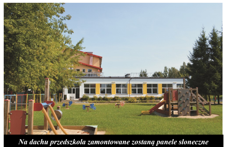
Na dachu przedszkola zamontowane zostaną panele słoneczne

Wszyscy cieszymy się, że termomodernizacja dobiega końca, a obie placówki swym nowym wyglądem zachęcają dzieci i pracowników do powrotu do lepszej, cieplejszej i przyjaznej środowisku szkoły. Dbajmy o nią i niech nam służy jak najdłużej.