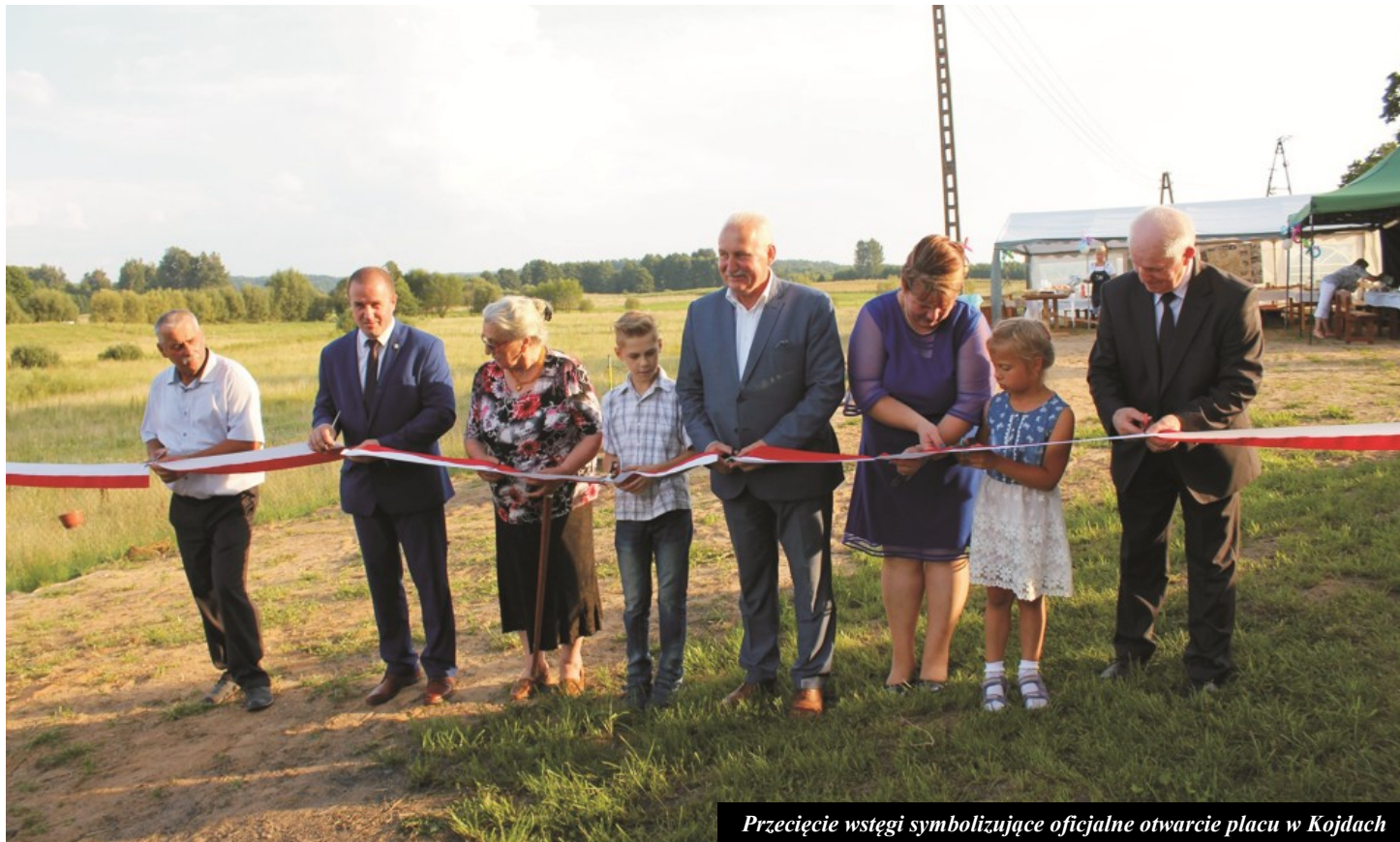
Przecięcie wstęgi symbolizujące oficjalne otwarcie placu w Kojdach