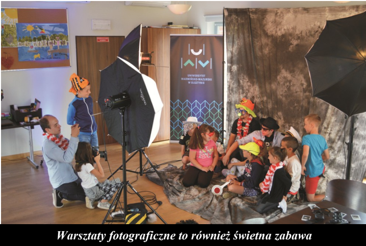
Warsztaty fotograficzne to również świetna zabawa