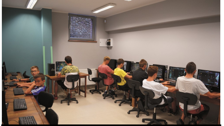
Zajęcia i gry komputerowe zawsze cieszą się dużym zainteresowaniem