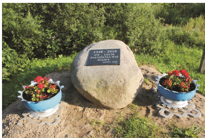
Pamiątkowa tablica została umieszczona na kamieniu w centrum wsi