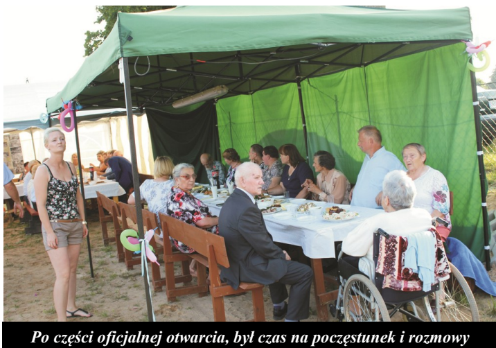
Po części oficjalnej otwarcia, był czas na poczęstunek i rozmowy