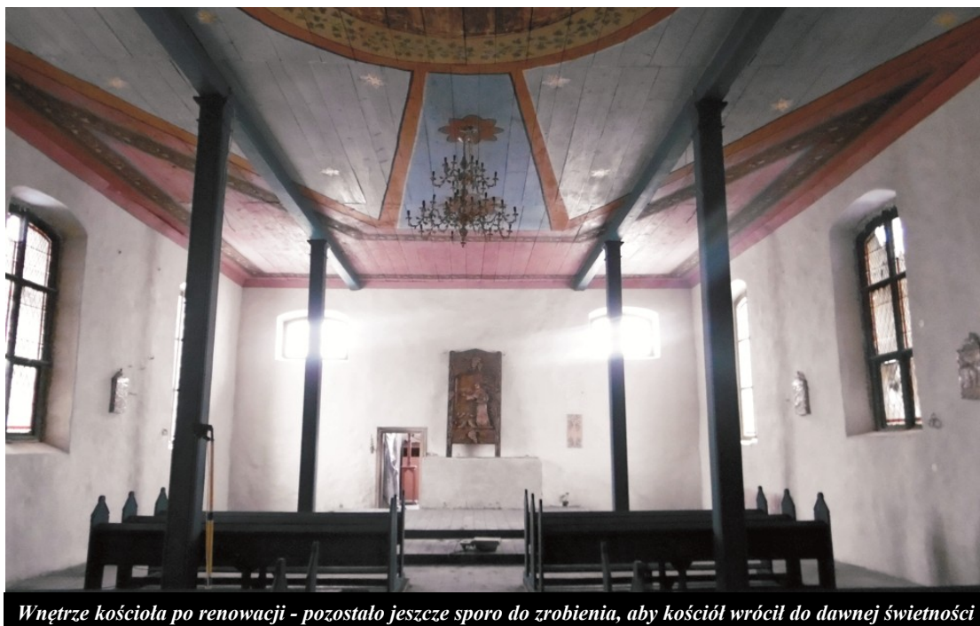
Wnętrze kościoła po renowacji - pozostało jeszcze sporo do zrobienia, aby kościół wrócił do dawnej świetności