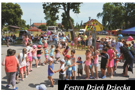
Festyn Dzień Dziecka

W 2018 roku odbyły się również większe imprezy plenerowe: 3 czerwca Dzień Dziecka przed budynkiem GOK w Łukcie, na scenie wystąpiła Akademicka Orkiestra Dęta oraz zespół Brylanty&Bażanty. 7 lipca Festyn z okazji Dni