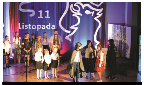
Obchody 100-lecia Odzyskania Niepodległości

11 listopada obchodziliśmy 100-lecie Odzyskania Niepodległości przez Polskę. Na naszej scenie wystąpili z patriotycznym repertuarem Zespół Pieśni i Tańca Kortowo oraz dzieci i młodzież z Zespołu Szkolno-Przedszkolnego w Łukcie i Mostkowie w przedstawieniu „Droga do Wolności”.