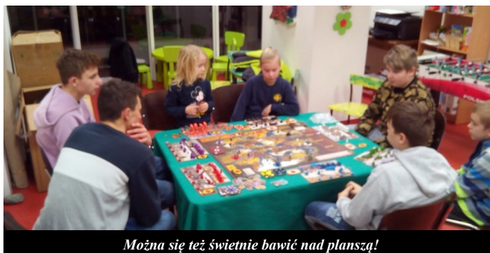
Można się też świetnie bawić nad planszą!

Dodatkową atrakcją podczas ferii były ćwiczenia strażackie, które odbywały się w naszym budynku. Dzieci mogły zaobserwować jak wygląda praca strażaków.