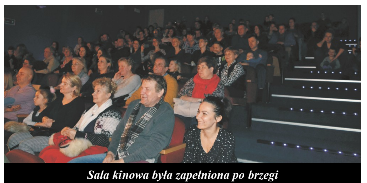
Sala kinowa była zapelniona po brzegi