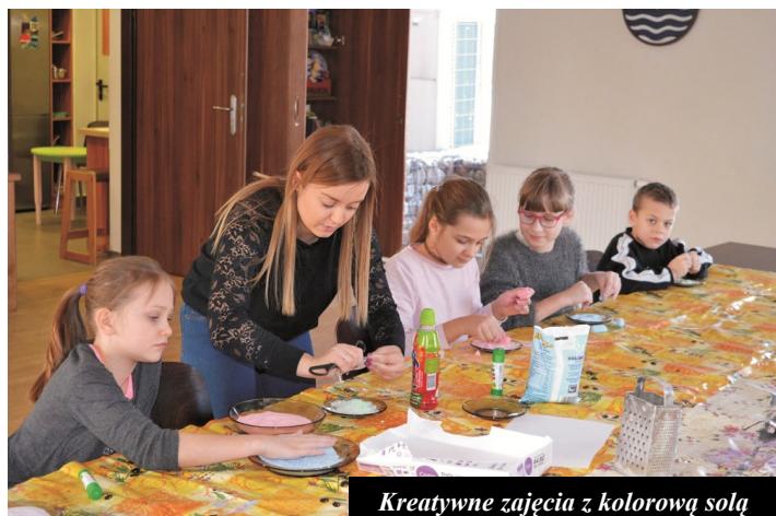
Kreatywne zajęcia z kolorową solą

Ferie w Gminnym Ośrodku Kultury minęły bardzo szybko, ale i intensywnie. Codziennie odbywały się zajęcia, każde dziecko znalazło coś dla siebie. W pierwszych dniach ferii dzieci na zajęciach plastycznych przygotowywały prezenty dla swoich ukochanych Babć i Dziadków. W kolejnych dniach piekły ciasteczka, tworzyły zabawki z dreb-