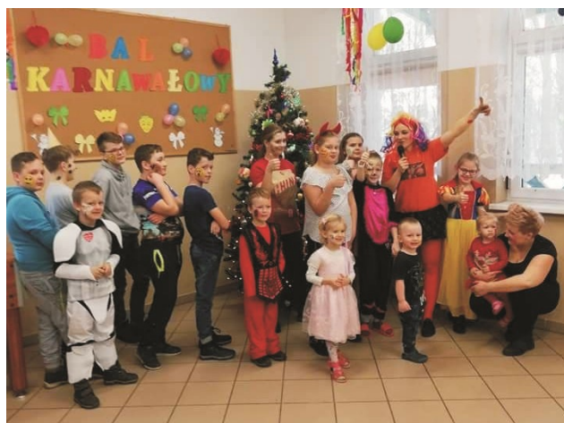
Świetlica Kozia Góra