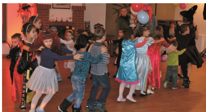
Na nasze bale dla dzieci zawsze zjawia się mnóstwo „przebierańców”

tańczyli z animatorkami w rytm muzyki. Jedną z atrakcji była chusta animacyjna przy której dzieci wraz z prowadzącymi bawiły się w "Owocową sałatkę". Następną zabawą było wspólne rysowanie człowieka. Każde dziecko malowało jedną część ciała z zamkniętymi oczami. Zabawom i śmiechom nie było końca.