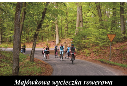
Majówkowa wycieczka rowerowa

W maju, podczas przyjemnej wiosennej pogody wspólnie z uczestnikami wyruszyliśmy na