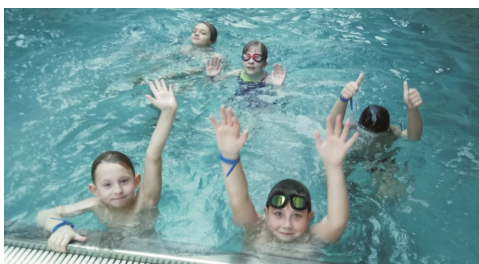
Przez 2 godz. basen w Morągu należał do nas!

na oraz ćwiczyły swoją wyobraźnię poprzez wykonywanie rysunków z kolorowej soli kuchennej. Zorganizowana została również wycieczka na basen do Morąga, gdzie wszyscy świetnie się bawili. Po ok. 2 godzinnej, wyczerpującej zabawie na basenie dzieci i młodzież z opiekunami udały się na pizzę.