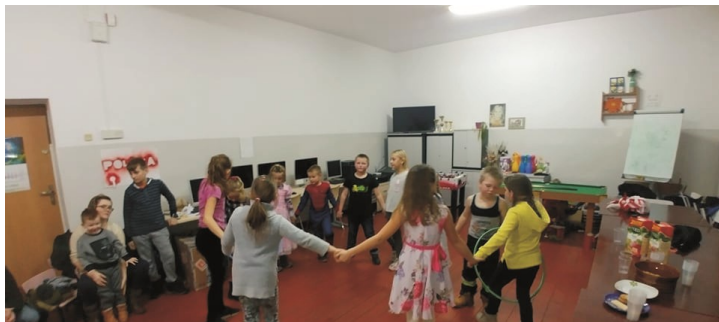
Ferie na świetlicy w Ramotach