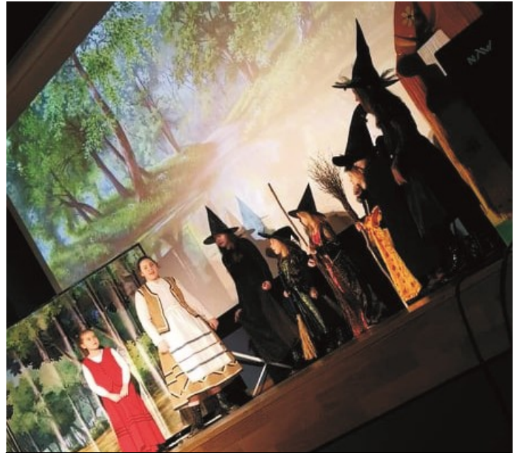
Młodzi aktorzy na scenie dali z siebie wszystko