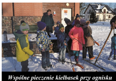
Wspólne pieczenie kielbasek przy ognisku

W drugim tygodniu ferii odbyły się zajęcia rekreacyjno-sportowe, na których tańczyliśmy i ćwiczyliśmy świetnie się przy tym bawiąc. Po zajęciach został wyświetlony film ani-