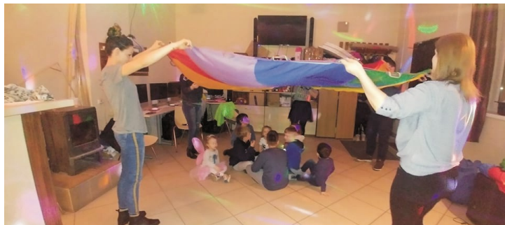
Zabawa na świetlicy w Pelniku

W ferie dzieci oraz dorośli mogli uczestniczyć w ciekawych zajęciach. Ozdabialiśmy różne przedmioty drewniane, jak np. skrzynki, malowaliśmy na koszulkach, a także farbami nie używając pędzli. Zorganizowano bale karnawałowe z animatorkami, na które dzieci przygotowały kolorowe maski. Chociaż jeszcze zima, to powoli zaczęliśmy z dorosłymi robić ozdoby na kiermasz wielkanocny. Wszystkich chętnych serdecznie zapraszamy na zajęcia do świetlic.