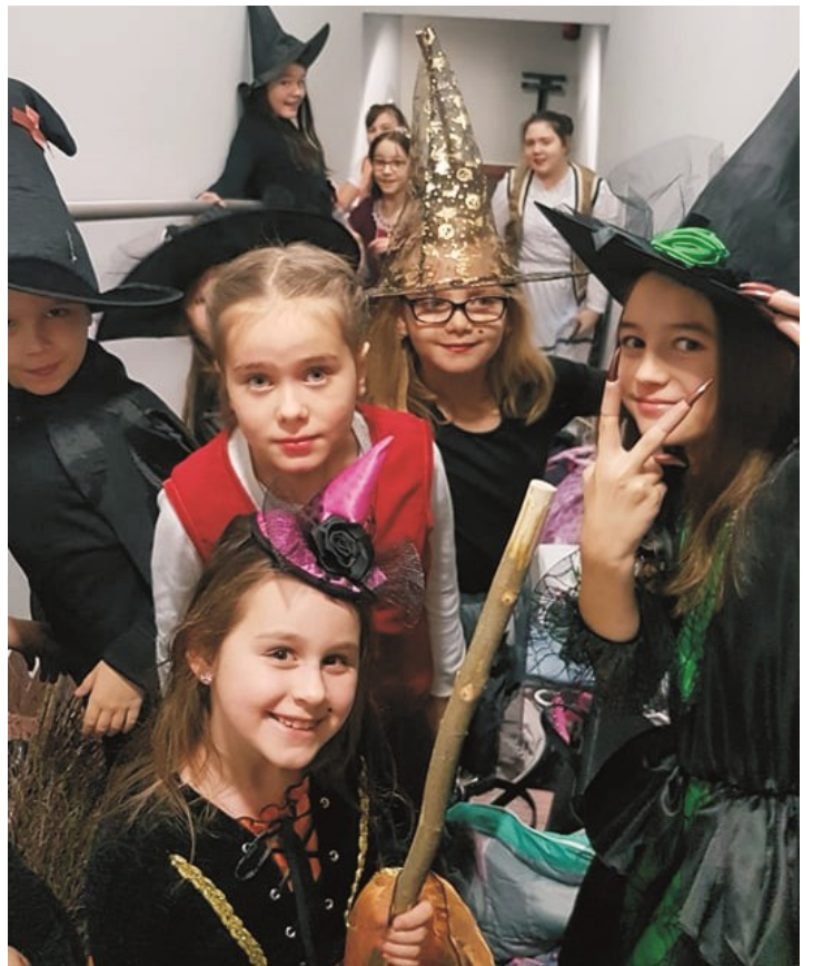
Za kulisami pełna gotowość