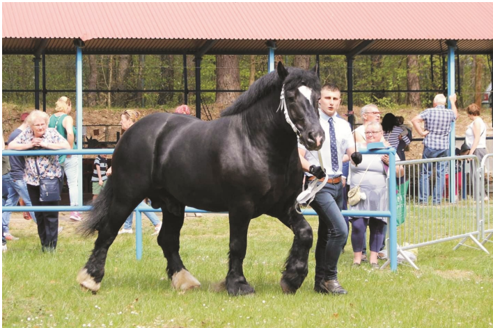
Pokaz ogierów ODR Olsztyn, maj 2019; ogier Sorentino