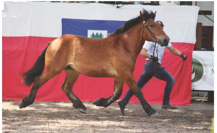
Ogólnopolski Młodzieżowy Czempionat Koni Rasy Polski Koń Zimnokrwisty, Kętrzyn