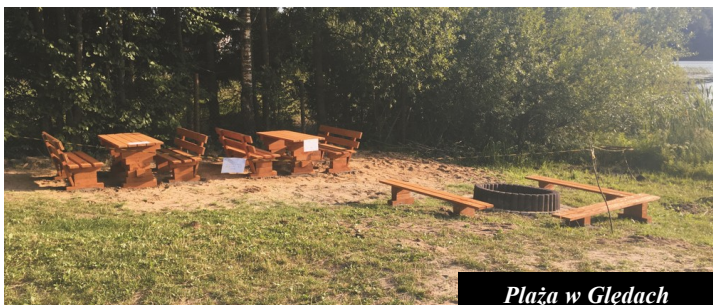
Plaża w Głędach

- 27 czerwca ekipa wolontariuszy przygotowała teren pod inicjatywę „Sportowo i rekreacyjnie nad jeziorem” - wyrównała i wysprzątała teren, 10 lipca dwóch wolontariuszy wykonało palenisko pod ognisko, a stolarz zamontował zamówione wcześniej zestawy siedzisk z ławami. Wszystkie te działania znacznie uatrakcyjniły to miejsce, które coraz częściej odwiedzane jest zarówno przez mieszkańców, jak i turystów.