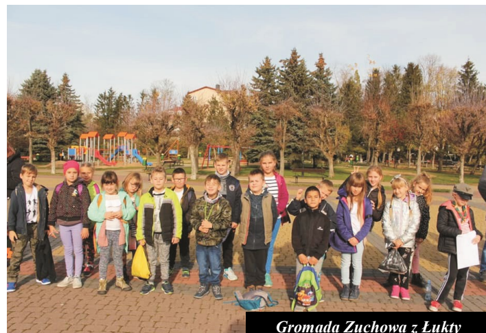
Gromada Zuchowa z Łukty