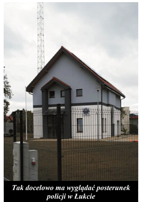
Tak docelowo ma wyglądać posterunek policji w Łukcie