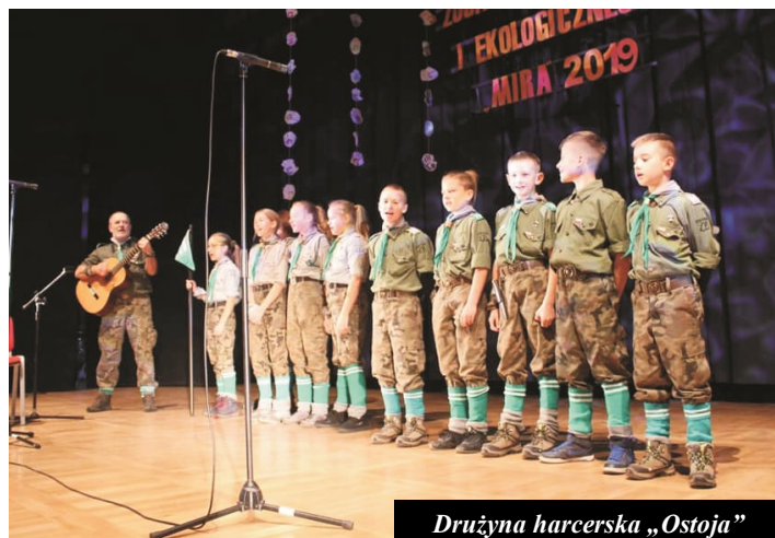
Drużyna harcerska „Ostoja”