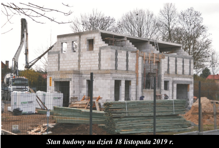
Stan budowy na dzień 18 listopada 2019 r.